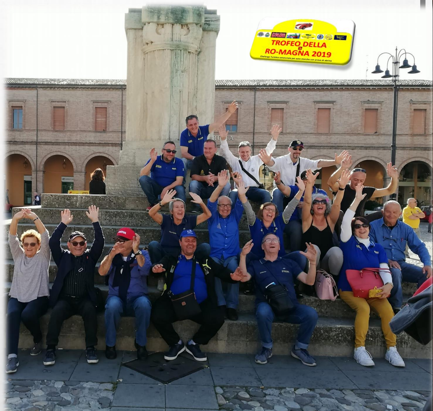
Una bella foto di gruppo al termine della gara santarcangiolese.. I sorrisi rispecchiano l'ambiente cordiale e simpatico del trofeo RoMagnolo...